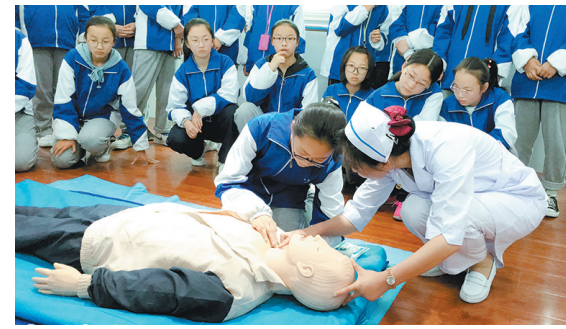
5月7日,在5·12护士节来临之际,商洛市洛南县中医院组织20多名专家和医师走进洛南中学为200余名师生讲解急救知识及日常卫生健康知识。

阎良是国家级无公害设施蔬菜标准化生产示范区,当前,正值春季温室大棚蔬菜种植生产的繁忙时节。针对现代农业园区用电需求增大、负荷集中的实际情况,阎良公司切实加强客户需求侧安全用电管理,组织用电检查人员走进辖区现代农业园区,上门服务,全面排查用电隐患,保证安全用电。