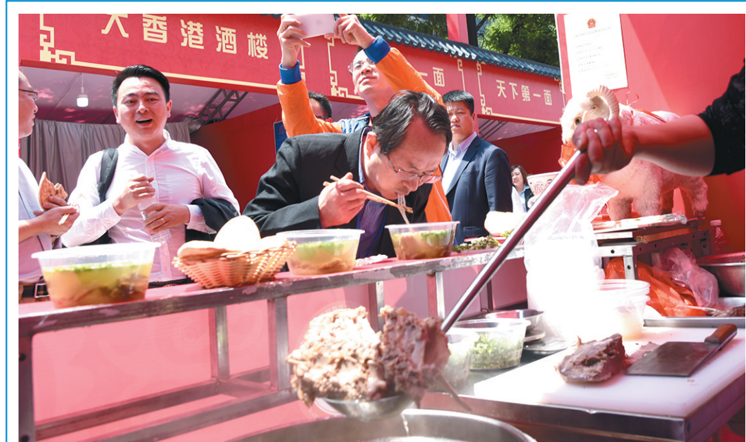
5月9日,由中国烹饪协会、陕西省商务厅、西安市人民政府主办的“2019‘中国菜’艺术节暨陕西国际美食文化节”在西安市曲江大唐不夜城启动。据介绍,本届美食节是我省发挥丝博会平台

作用,举办的第二届陕菜品牌宣传月活动,也是中国烹饪协会联合地方政府举办的“中国菜艺术节”首场活动,是一场全国性烹饪行业活动。