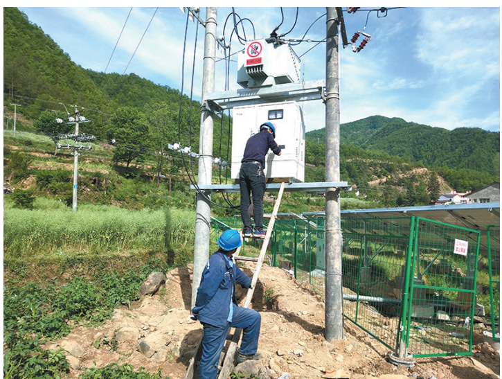
近日,汉中市镇巴县小洋镇白河村光伏电站正式并网发电。该电站总投资210万元,建设规模300KW,年平均发电量42万KWh,年收益达35万元,发电收

今后,凡是由西安市统计局开展的社情民意电话调查,外呼电话显示将由原来“62”开头的8位数字组成的12个号码,统一改为“12340”。