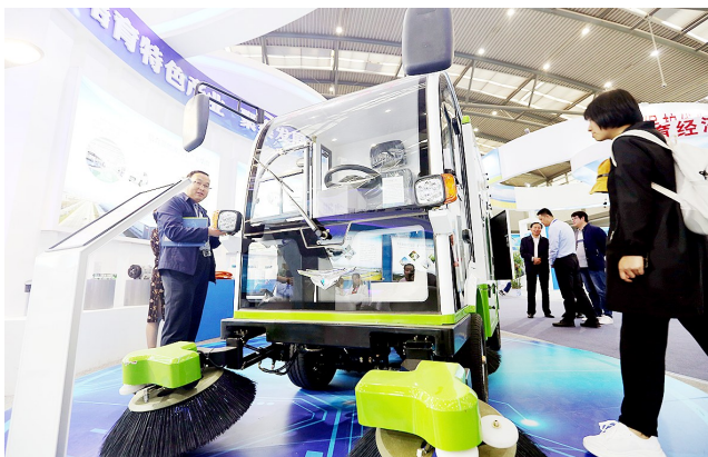
体验人行道清扫车。该产品采用240L垃圾桶,液压升降,方便更换,输送桶能耗低,噪音小,易检修,清扫粉尘效果更好。