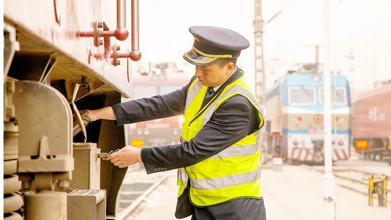
5月12日,陇海铁路沿线遭遇今年入夏以来首场沙尘暴侵袭,陕西省气象台发布沙尘暴橙色预警,中国铁路西安局集团有限公司西安机务段迅速采取有效措施全力应对沙尘天气。图为火车司机出库前在风沙中检查机车设备。

期满后的维修和更新、改造,不得挪作他用。物业服务企业利用公共部位、共用设施设备从事经营性活动的,应当在物业服务合同中约定。经营所得的全部收入70%归业主使用,可用于补贴业主委员会费用,可纳入住宅专项维修资金,也可以按照业主大会的决定使用。其余30%部分补贴物业服务企业利用共用部位、共用设施设备经营成本。经营所得应当单独分类列账,独立核算,每半年公布一次经营所得收支情况,并接受业主监督。 如果对《条例》有任何意见或建议,可于5月29日前致函西安市雁塔区建工路50号陕西省司法厅立法二处(邮编:710043),或拨打电话029-87292594反馈。