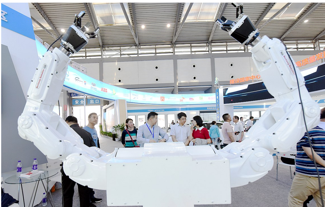
丝博会期间,2018陕西省军民融合技术创新竞赛获奖产品——百思拓微机器人亮相丝博会,吸引客商关注。这款机器人在“高温、危险、爆炸”等环境下可替代人工作业。同时也广泛用于文化旅游、生物医药、科研教育等领域。