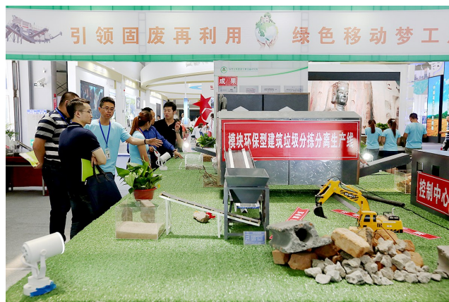
引领固废再利用 绿色移动梦工厂。该模型展示了建筑垃圾分拣生产线的流程,通过技术可使建筑垃圾中的砖和混凝土分离,有效提升建筑垃圾资源回收利用率。 本报记者 鲜康 摄