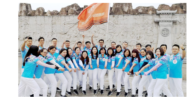
由陕西省国资委举办的第二届职工健身运动会健步行活动于5月7日在西安汉城湖景区拉开帷幕,此次活动共有52支参赛队近3000余人参加。

本报讯(王新权)日前,宝钛集团召开2018年度表彰大会,公司出资25万元隆重表彰了第二届“宝钛工匠”。 大会为当选“宝钛工匠”的王敏、张斌、周传胜、张兵、秦忠梅5名一线职工颁发了奖牌、证书,并且为每人奖励5万元。会议还表彰奖励了2018年度公司53名先进生产(工作)者、2018年度劳动竞赛立功项目,表彰奖励了2018年度班组建设先进集体和优秀班组长、班组建设先进工作者、年度星级班组。同时,大会还为今年命名的宝钛劳模和工匠创新工作室授牌。 去年,该公司开展了“宝钛工匠”命名表彰活动,在企业大力弘扬工匠精神和创新精神,树立尊重劳动、尊重知识、尊重技能、尊重创新的价值导向。