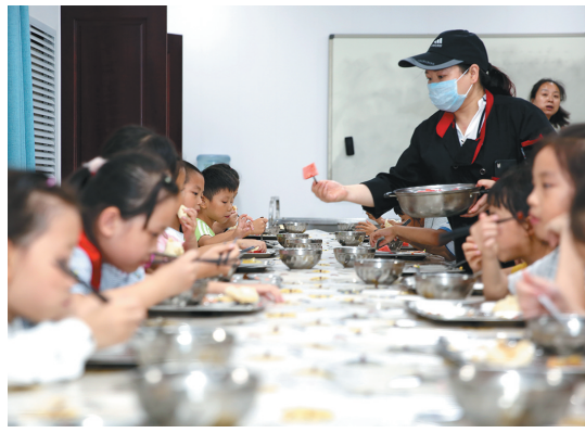
厨师为学生添加饭后水果。