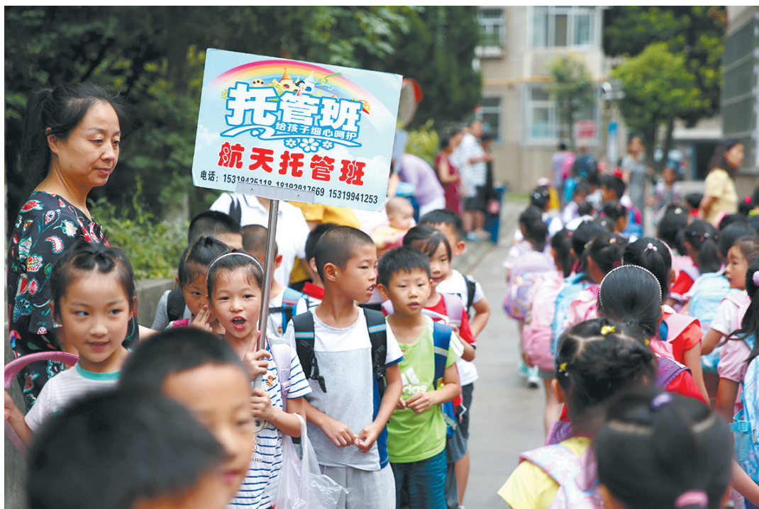
16时30分,学生放学后,托管老师将孩子组织到一起准备返回托管课堂。