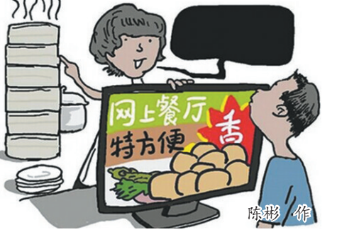
比,这简直是九牛一毛,很难对外卖平台形成有效的震慑。

网络餐饮问题事关食品卫生安全,但从此前处罚的部分网络餐饮案件来看,相关部门对外卖平台的平均处罚金额不过10多万元。有专家表示,与网络餐饮平台巨大的交易量和交易金额相