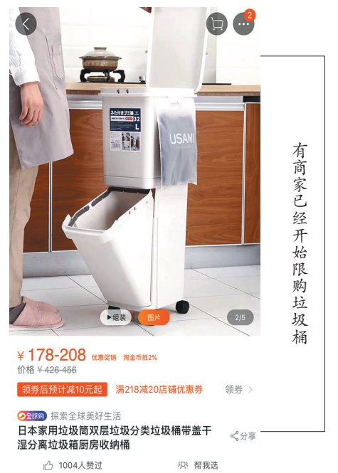
有商家已经开始限购垃圾桶

强制垃圾分类后,投放湿垃圾需要破袋处理。为了省麻烦,部分市民希望减少厨余垃圾产生量,这意外带火了一款小众商品