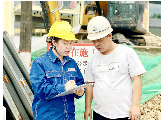
西安市长安区学府大道中段工程被长安区政府列为2019年度打通一批断头路中的一条。国网长安供电公司积极与长安建设局协调,对学府大道10千伏线路进行重新规划设计,为打造美丽长安添砖加瓦。图为电力职工正在为道路施工人员进行电力规划方案。

此外,宋树立表示,国家卫健委将开展健康促进县(区)建设,着力提升居民健康素养。以县(区)为细胞,推行、推进将健康融入所有政策的工作,开展“健康中国行”宣传教育活动。(吴佳佳)