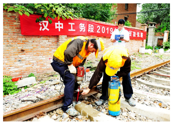
7月16日,中国铁路西安局集团有限公司汉中工务段举行线路职业技能竞赛,44名线路工进行了理论和实操综合竞技比武。图为该段职工正在进行线路技能竞赛。周俊英 摄

在集团承建的2#科研楼在4-6月份综合质量评比中获第一名,在安装工程专项质量评比中获得第一名;高端人才生活基地项目B3-10、B3-11地块在5-6月份劳动竞赛中均获综合评比第一名,并获文明施工单项第一名。48#、52#电梯被评为红旗电梯,集团总工程师刘建明,项目经理王帅峰被评为先进个人。