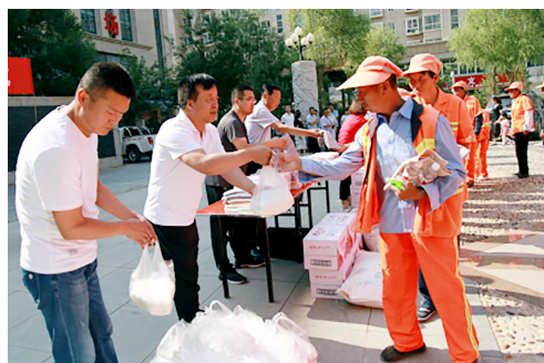
7月11日,榆林市横山区总工会在政府广场举行夏季“送清凉”活动启动仪式,为全区环卫工人发放了花露水、白砂糖、矿泉水等防暑降温物品。