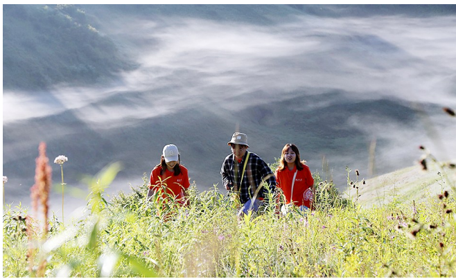
盛夏时机,平利县正阳镇大草原百花齐放,云雾缭绕,如诗如画,吸引众多游客参观游玩。

上半年,民营企业需求占市场总需求的75.65%,员工人数在300人以上用人单位占招聘单位总数的56.74%。就业市场上民营企业比重大,规模以上用人单位需求活跃,反映出我省民营经济通过调结构、转方式,质量不断提高,为市场吸纳就业的可持续性提供了较好的支撑。同时,在用人需求方面,制造业、批发零售业、住宿和餐饮业等十大行业占到需求总量的84.84%。