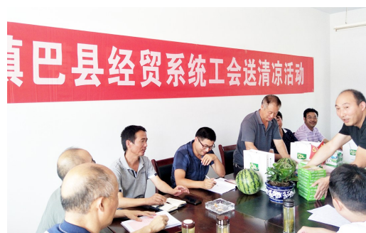
7月14日,汉中市镇巴县经贸系统工会到帮扶村观音镇大市川开展送清凉慰问活动。为奋战在扶贫一线的第一书记、驻村工作队队员送去防暑降温品。