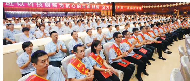
9月2日,陕重汽召开第四届科技创新大会,重奖科技创新精英。

本报讯(郭喜强)9月2日,陕西重型汽车有限公司(以下简称陕重汽)和陕西法士特汽车传动集团有限责任公司(以下简称法士特)先后召开科技创新大会。两家企业各拿出千万余元资金重奖