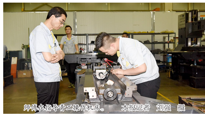
师傅在指导青工操作机床。

试车工李晓佳主动承担“车削加工断屑”攻关任务,不但清除了自动线上的“拦路虎”,还获得了3万多元奖励。吴鑫、程筱、冯强等同事在羡慕的同时,也达成了共识——只要把事干好了,领导看得见。在榜样的带动下,他们积极投身各种急、难、工作中,也更加注重学习、钻研…… 从陕西首批“三秦工匠”李晓佳开始,再到田浩荣、杨忠洲,宝鸡机床集团有限公司(以下简称宝鸡机床)一年获评一名“三秦工匠”。不仅如此,企业还涌现出了一批像麻建军、张云飞、李宏林、翟江利等,获得陕西省十大杰出工人、陕西省机械行业产业工匠等荣誉称号的高技能人才。