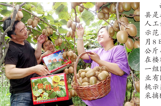
西安市周至县是我国猕猴桃人工栽植标准化示范、基地县。9月8日,游客以每斤40元的价格在楼观镇送村一组陕西蔚然农业有限公司猕猴桃示范基地园中采摘猕猴桃。

等14个车站,是关中城际铁路网“核心环”的重要组成部分,更是沿线政府和老百姓期盼的平安路、富民路。对完善完善关中综合交通网,促进沿线社会经济发展和大西安建设具有重要意义,是省铁路集团积极响应中央和省省委省政府关于增投资、稳增长工作部署的重要举措。