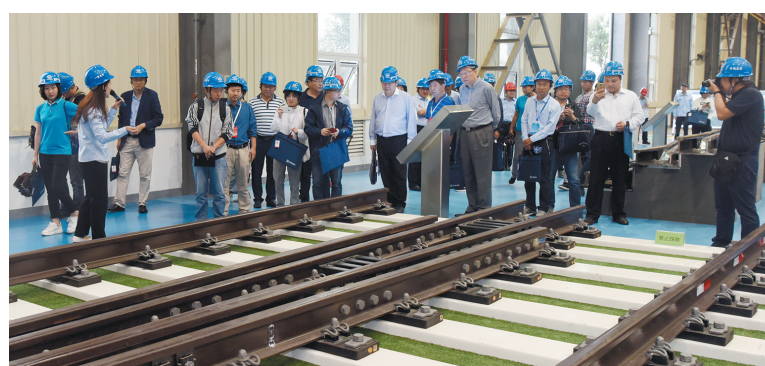
来自全国的中铁宝桥集团工会媒体记者。

么?”大家不约而同回答道——品质。 1966年建厂,仅有800多名职工的原铁道部宝鸡桥梁厂,之所以发展到如今拥有11家子公司、4100多名职工的大型国有企业集团,完全得益于“品质生存”战略。 用洪军的话说,“高品质是宝桥能‘牛’得起的最大底气。” 2016年,亚洲最大的山区钢箱梁悬索桥——云南龙江特大桥建成通车。作为大桥总设计师的李正熔感慨地说:“仅仅一年多时间,宝桥就把我绘制的蓝图变成了现实。有这样的合作伙伴,我感到骄傲!” 这一组数据,更能说明中铁宝桥产品的“高品质”——国内50%的高速铁路道岔、30%以上的大型钢桥梁出自“宝桥制造”。每年从这些产品上过往的旅客不下60亿人次。