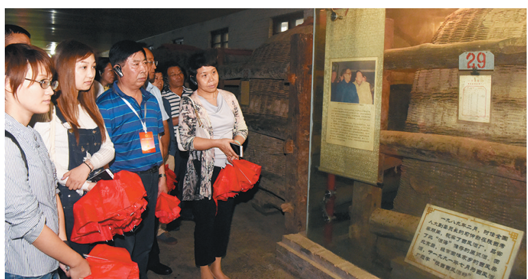
来自全国的中铁宝桥集团工会媒体记者在陕西西凤酒股份有限公司采风。

不紧不慢、轻松自如……5号选手王宁手握铁合金歌,在甑锅里时而顺时针、时而逆时针。同时将酒醅均匀疏松地铺在甑内冒出蒸气的位置……日前,在陕西西凤酒股份有限公司(以下简称西凤公