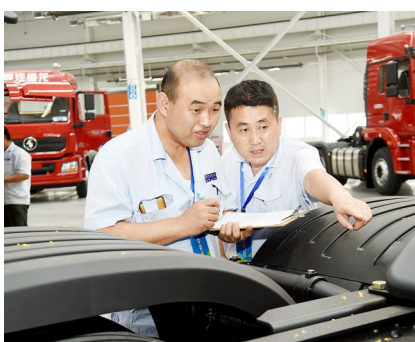
9月6日,陕汽控股质量检验技能大赛实操比武落下帷幕。来自23个单位的138名员工参加了此次竞赛,旨在实现质量检验员向懂设计原理、懂装配工艺、懂失效模式、懂供应商能力的“四懂”检验员转变,让质量管理更加精准。

灾情发生后,汉中公路局佛坪公路段迅速组织职工和机械设备上路防汛抢险,清理路面堆积的泥土石块,在2小时内清理便道,使受阻车辆顺利通过塌方区域。截止至10日下午,该段已投入大型挖掘机1台、铲车3台、运输车辆4辆,投入劳动力60余人次,清理塌方1400余立方米,现在道路已畅通,沿线塌方仍在清理中。