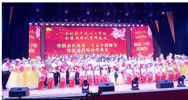
9月9日,华阴市举行庆祝活动,迎接第35个教师节并对优秀教师进行表彰奖励。华阴市委市政府拿出300万元重奖优秀教师,同时号召全市教育工作者要做“四有”好老师。