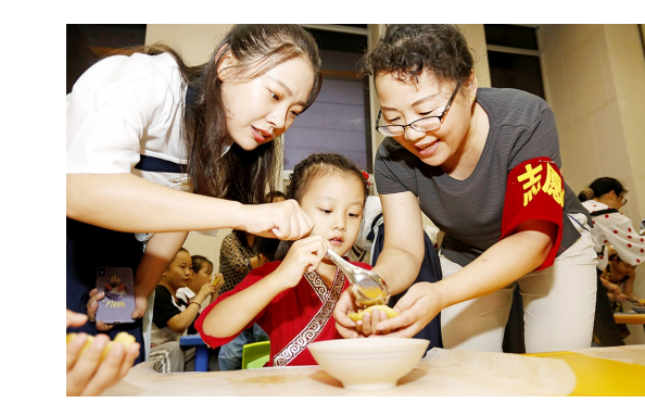
9月12日,渭南市博物馆开展“巧出饼师心”手工制作月饼,“我在渭博修文物——小小修复师”体验活动,小朋友们手工制作月饼,体验陶器文物修复,感受传统文化魅力。

本报讯(李红)近日,为了促进公司的更好发展,丰富客户文化生活,和意保险安康分公司聘请我省著名残疾人作家王庭德作为艺术顾问,指导企业文化建设。 仪式现场,首先对王庭德的个人经历和艺术成就做了简短介绍,随后公司副总经理刘晋授予聘书,并由衷感谢王庭德对该企业的大力支持。这是多次被教育界聘为校外指导老师的王庭德,继中国少年新闻学院、培新小学等之后,再次成为企业文化建设的代言人。