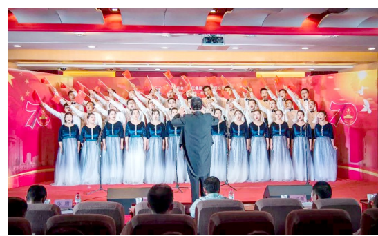
9月11日,陕西稀有金属科工集团有限公司、西北有色金属研究院举办“放歌新时代、共筑中国梦”合唱竞演活动。经过激烈角逐,离退休代表队荣获特别演出奖,西部钛业公司代表队和院本部机关代表队获得一等奖,稀有公司代表队等6家单位获得二等奖,西诺公司代表队等5家单位获得三等奖。

值得一提的是,近年来,镇安县总工会大力推进“互联网+”工会工作新模式,实现网络覆盖基层职工群众、工作覆盖基层工会组织。去年,镇安县总工会在抓好帮扶村精准扶贫工作的同时,还开展了农民工会员实名制普查,摸底工作,新增农民工会员1146人。同时深化职工之家建设,部署开展了“181050”行动,即:年内促使建成1个全省工会工作先进镇、8个规范化机关事业单位工会、10个规范化企业工会、50个村级工会。截至目前,全县新建村级工会69家、8家规范化企业工会、40个村级工会、6个规范化机关事业单位工会。 □孙守雅 小松