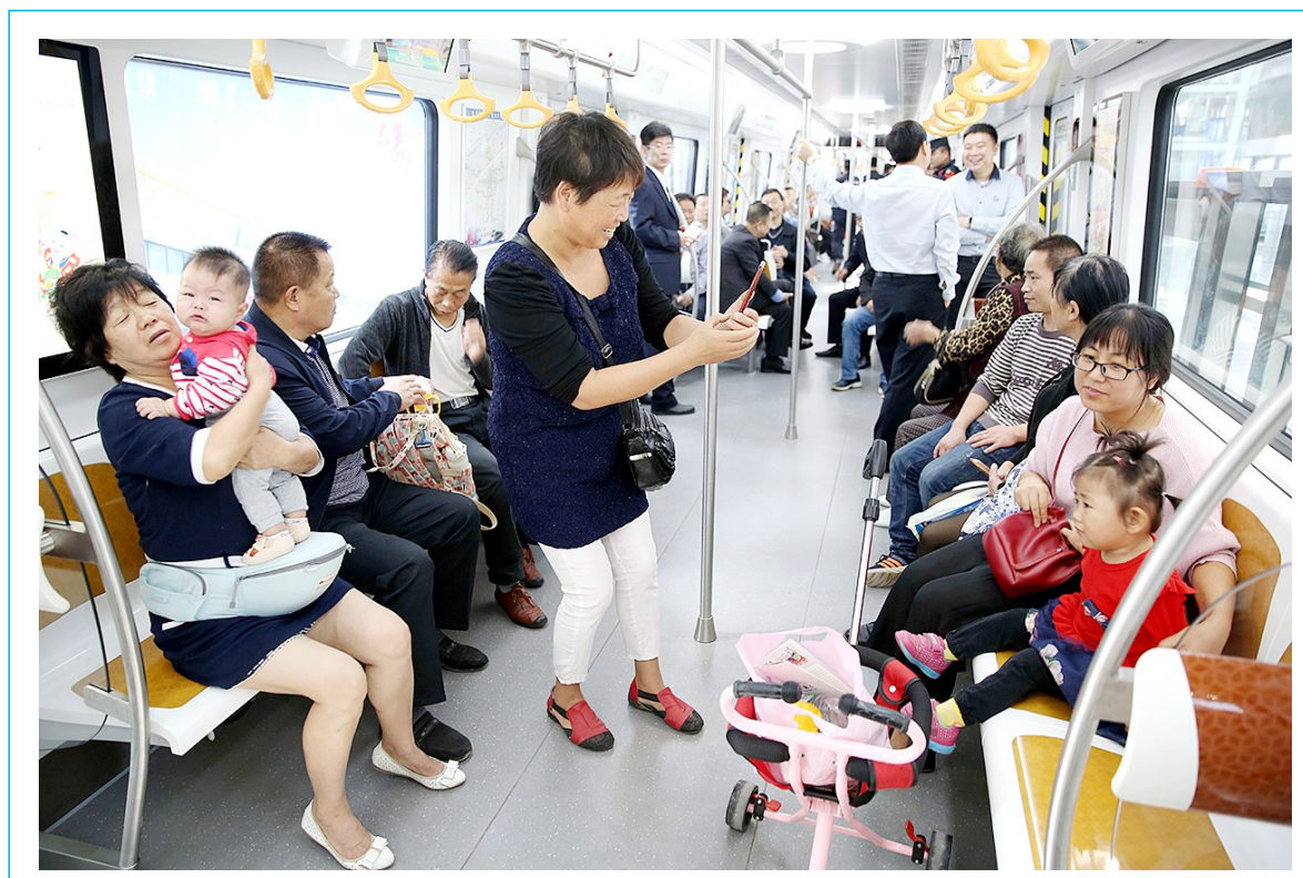
9月23日,陕西城际铁路公司邀请媒体和市民代表提前试乘西安北至机场城际铁路。西安北至机场城际轨道项目(简称“机场城际”)是陕西省第一条城际铁路,连接西安北客站和西安咸阳国际机场两大交通枢纽,项目建成对推动大西安建设,提升西安国家中心城市影响力具有重要意义。据了解,机场城际铁路目前已经具备所有开通条件,于近日将开通运营,单程票价16元。市民可在北客站(北广场)与西安地铁四号线同台换乘,可转乘高铁和西安地铁二号线,向东预留与西安地铁十四号线贯通运营条件。

所以,副业可以有,但要理性权衡。因为每个人的情况不同,不同岗位性质不同,强度不一。一般来说,主业提供“稳定”和“保障”,就要求人们付出精力和成本,做好本职工作。如果陷入盲目跟风的误区,难以兼顾,不但做不好副业还影响到主业甚至因此丢掉工作,未免得不偿失。毕竟在现实中,能把副业搞得风生水起的人,终究还是少数。当然,像《三体》作者刘慈欣那样,作为一名电厂职工,因为爱好写作把副业做到极致的,也不妨把副业变为主业。(张冬梅)