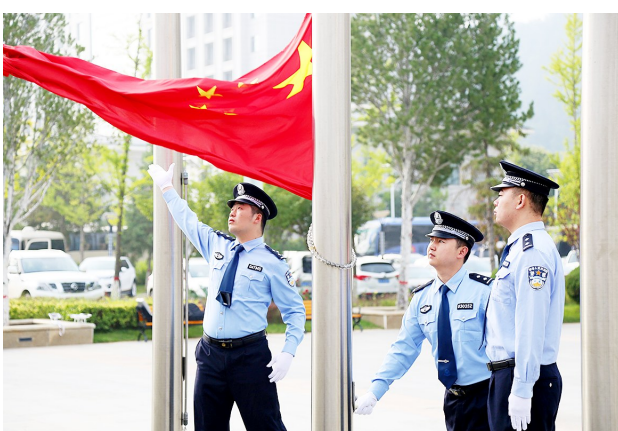
近日,在新中国成立70周年到来之际,延长油田公司开展升国旗仪式,强化爱国主义教育,激发职工爱岗敬业的热情。

地区综合运输通道的衔接,联通兰州、西宁、乌鲁木齐、西安、银川等西北重要城市。结合西北地区禀赋和特点,充分发挥铁路长距离运输优势,协调优化运输组织,加强西部陆海新通道与丝绸之路经济带衔接,提升通道对西北地区的辐射带动作用,有力促进西部地区开发开放。 据介绍,广西是陕西水果的主销市场,也是陕西水果出口以东盟为主的“一带一路”沿线国家的重要通道,每年通过广西凭祥口岸出口到东盟各国近25万吨,货值近8亿美元。