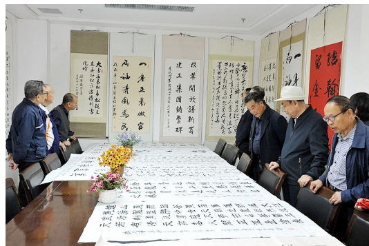
为丰富离退休老员工的精神文化生活,国庆前夕,陕建二建集团举办了离退休老员工书画展,共有50幅作品参展。

通过一系列活动的开展,在广大业主居民的积极配合支持下,所属社区环境面貌和业主满意度得到了进一步提升。