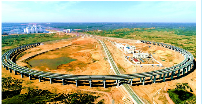
铁路物流集团神朔铁路线路全长243.96公里,北起包西铁路神木西站,同时连通红柠铁路,南与浩吉铁路(原称蒙华铁路)靖边北站相接,是保障浩吉铁路运量的重要集运线路,也是榆林市煤炭转化项目的内部运输线路和矿区各煤矿的公共运输外运通道。项目的建设对完善矿区交通基础设施,促进榆林地区能源开发、优化“北煤南运”通道、保障国家