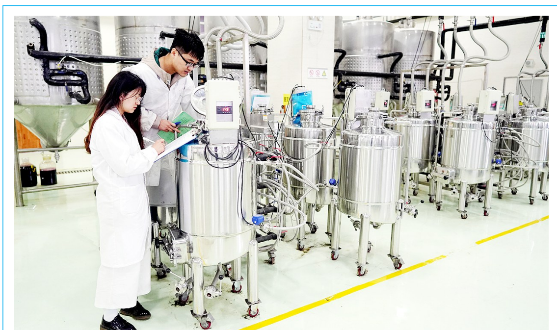
10月15日,西北农林科技大学葡萄酒学院学生在学院酿酒区监测记录葡萄酒的发酵情况。西北农林科技大学葡萄酒学院成立于1994年,是我国首所专门从事葡萄与葡萄酒

我国婴幼儿配方乳粉实施从配方研发、原料查验、生产管控、出厂检验到销售的全过程严格监管。生产企业对主要原料、出厂产品全项目批批检验,从2016年起,市场监管部门开展“月月抽检、月月公布”。截至2019年6月,共监督抽检9305批次产品,实现国内所有在产企业全覆盖、食品安全国家标准规定的60多个检验项目全覆盖。