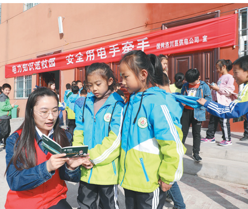
10月18日是第十五个“陕西爱电日”,国网洛川供电公司组织青年志愿者走进洛川县曙光小学开展“安全用电进校园”宣传活动,讲解安全用电常识,为该校师生上了一堂生动的安全用电课。