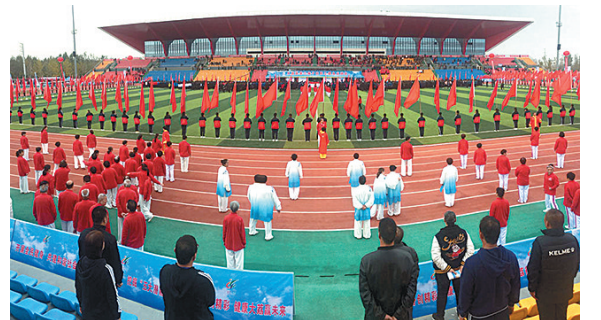
10月21日,大荔县第三届干部职工健身运动会开幕,共有62支代表队2259名运动员参加了运动会。此次运动会充分展示了大荔县广大干部职工积极向上、奋勇争先的良好精神风貌。

必须第一时间冲到现场处理。地面保障人员需要提前了解每一架飞机的情况,如油箱的位置,以便判断会不会产生二次爆炸。 严密的飞行安全保障措施,得到了众多国内外飞行表演团队的认可。在国际上享有盛誉的英国雅士飞行队为此次航展贡献了单机和多机编队的特技飞行表演。队长杰兹·霍普金森说:“包括这一次,我已是第九次到中国来表演。我发现中国的飞行特技表演市场一直在发展中,专业化程度越来越高,我们很享受在中国进行飞行表演。” (毛海峰 付瑞霞)