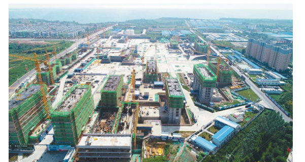
由于项目占地面积、建筑面积大,专业交叉多,为强化安全管控,近日,陕建四建集团成功使用四轴无人机,对施工现场、进度进行航拍,此举有助于提高现场管理效率,灵活调动现场资源。

国信息通信行业从无到有、从小到大、从弱到强的发展历程,记载了一代代信息通信行业人艰苦奋斗、产业报国的崇高追求和使命担当。”国资委宣传局副局长刘福广在发布会上表示,中央企业要继续发挥好表率作用,保护和利用好企业的工业文化遗产,带动产业链企业共同做好有关文化遗产保护工作。