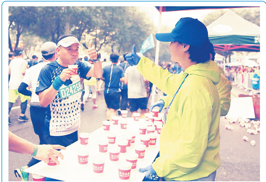
10月20日凌晨4时半,陕建三建集团的200多名青年志愿者在西安国际马拉松赛5公里和23公里服务点紧张地忙碌着。据悉,这些志愿者来自该集团总部和各基层单位,赛前还邀请赛事专员给他们开展了志愿者岗前培训。这已经是他们连续第三年组织志愿服务队参加西安国际马拉松赛事,得到了赛事组织部门的肯定和表扬。