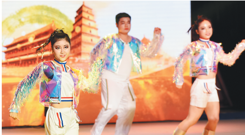
西安市津东新城总工会代表队