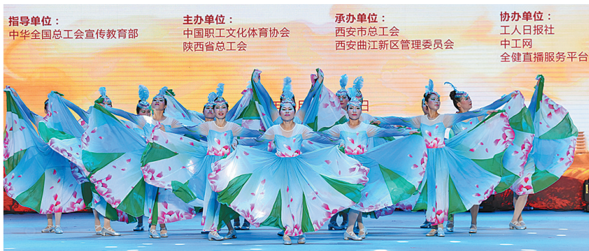
浙江省绍兴市海滨新城沥海镇悦舞舞蹈队

“奋斗不止,拼搏不息”成了34名队员最近几天的写照。“每个人都在用心,这次活动不仅团结凝聚了人心,还充分实现了陕建‘健康陕建’的目标,体现了工会组织引领广大职工听党话、跟党走的政治担当!”滕天天说。本报记者 王何军