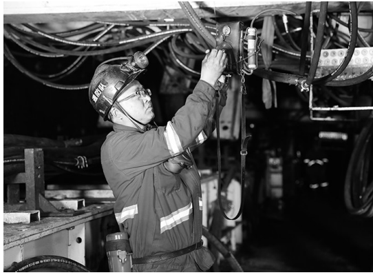
为扎实开展好“百日安全”活动，黄陵矿业双龙煤业紧紧围绕“控风险、除隐患、抓整改、促提升”活动主题，出实招，下狠劲，多措并举强化全员安全防范基础。