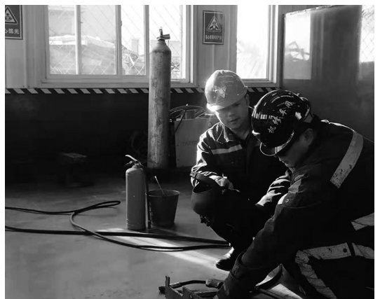
“小技巧”化解“小烦恼”、“上纲上线”的职业健康、“一个都不能少”的全员培训……随着“百安活动”不断加码，各区队、各班组、各具安全特色的“小确幸”，给陕北矿业中能公司“百安活动”增添了新魅力。