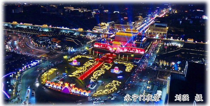
永宁门夜景