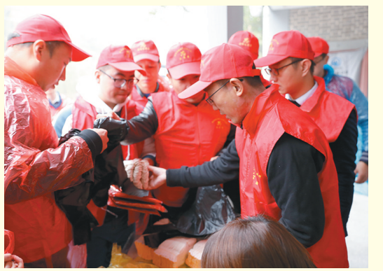
近日,华阴市文明办等单位联合秦岭仙峪景区举行新时代文明实践“关爱大自然,保护大秦岭”志愿服务活动启动仪式。旨在用实际行动为建设生态秦岭、美丽华阴作出应有的贡献。