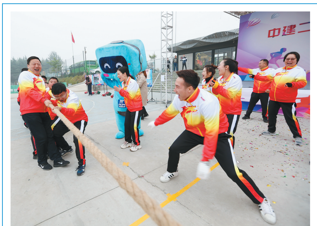
11月9日,中建二局二公司第六届“快乐工作、快乐生活”的理念,进一步促使他们热爱生活,努力工作。 130余名职工参加了此次运动会,践行

2019年1-9月,西安中高端人才平均月薪为13456元。分行业来看,西安房地产行业中高端人才平均月薪最高,为14362元,依次还有电子通信、金融、制药医疗行业,平均月薪超过13000元。