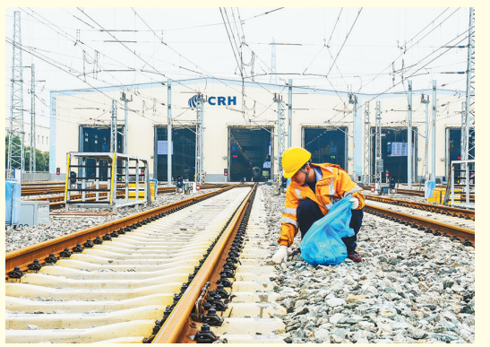
连日来,中国铁路西安局集团有限公司西安动车段组织对管内高铁线路周边的异物进行排查清理,防控设施设备失管失修和异物遗留、上线等重大隐患,为2020年春运创造良好的铁路安全环境。