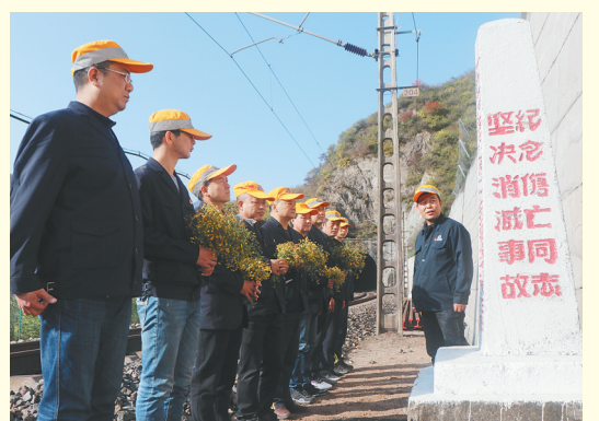
近期,中国铁路西安局集团有限公司宝鸡工务段党委强化思想教育,组织党员深入管内红色教育基地开展爱党爱国教育,引导全体党员为“交通强国、铁路先行”历史使命作出贡献。图为该段宝鸡桥隧车间党总支组织党员前往陇海线宝天段上行线K1329+200处祭扫烈士纪念碑。