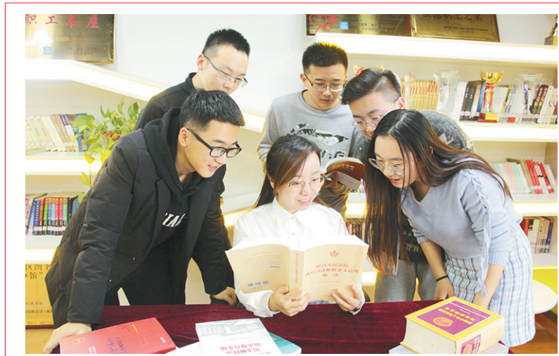
近日,中建二局二公司西北分公司成功举办第三届法律文化节暨安全生产法律法规主题普法月活动。西北分公司法律合约部法务专员为员工们进行了普法讲解,有效地提高了广大职工学习法律知识的积极性,增强了职工的安全生产意识。

“4+7”是指包括西安在内的4个直辖市、7个副省级城市,开展药品集中采购和使用试点工作。试点自2019年3月25日全面实施以来,总体运行平稳,执行进度超过预期。截至2019年11月底,25个中选品种有40个品规发生采购,总数量7975.03万片(粒/支),占本地区标量的量的1835.53%,采购总金额11750.01万元。未中选品种,采购总数量1168.62万片(粒/支),采购总金额8420.14万元。