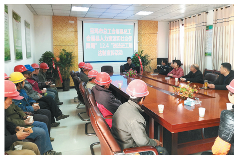
宝鸡市总工会举办宪法进企业活动,为一线农民工讲授法律知识