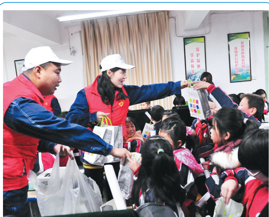
近日,国网商洛供电公司输电运检中心和团委的青年志愿者,给商州区城关街道办四皓小学的60名小学生送来了棉手套、围巾和袜子,并给孩子们讲解电力知识,普及安全用电常识。

安全隐患。 三是加强消防安全管理,保障生命财产安全。要严格落实消防安全责任制,明确各级、各岗位的消防安全职责。 四是落实家校联动,防止“监管真空”。要采取多种方式不断增强家长安全意识,切实履行好孩子的看管监护责任。要引导家长远离无证培训机构和幼儿园,保障学生合法权益。要通过家长会、家访、微信群、致家长一封信等多种方式提醒家长寒假期间准确掌握孩子动向,切勿出现“监管真空”。要特别关注农村地区、偏远地区留守儿童冬季安全看护,发动社会各界齐心协力,保障孩子们平安过好元旦、春节。