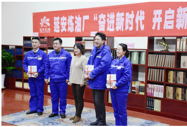
↑为迎接新年到来,2019年12月25日,延安炼油厂举办“奋进新时代 开启新征程”读书分享会,本次活动旨在丰富职工文化生活,为企业高质量发展凝聚思想合力,活动现场还为各基层党组织赠送了图书。