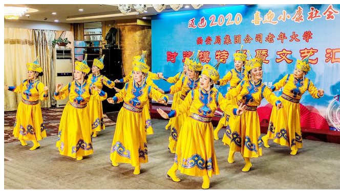
←2019年12月27日,中国铁路西安局集团有限公司老年大学举行“迈进2020,喜迎小康社会”教学成果展示会,百余名学员欢聚一堂,展示教学成果。图为舞蹈班的学员们表演蒙古舞。