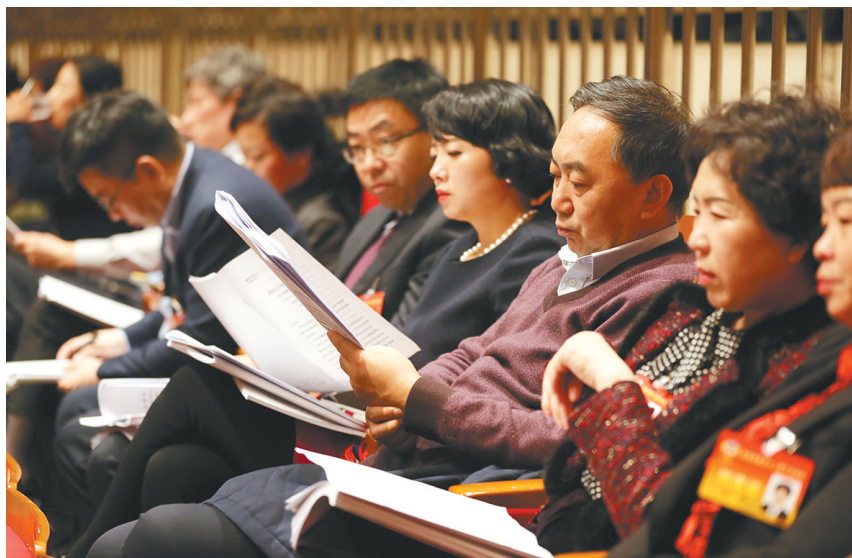
认真聆听政府工作报告