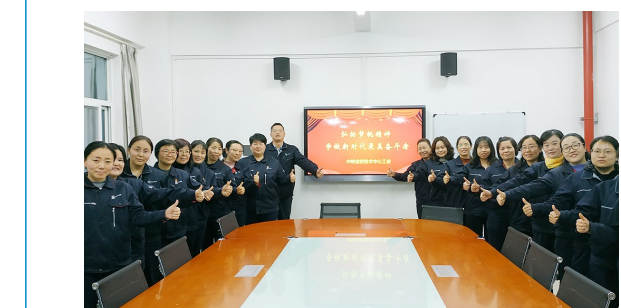
近日,中铁宝桥集团所属各级女工组织围绕集团中心工作,积极开展女职工“岗位建功”、素质提升、关爱工程等系列活动,掀起了学习模范、主动干事、比学赶超的工作热潮,为集团高质量发展贡献巾帼力量。

□王璐 杨焯 俞卜丹 实现净利润1.3万亿元,同比增长10.8%,圆满完成净利润“保7争9”目标……在1月15日举行的国新发布会上,国务院国资委秘书长、新闻发言人彭华岗公布了中央企业2019年经济成绩单。 据透露,目前国资委正在会同有关部门抓紧制定《国企改革三年行动方案》,制定思路瞄准三大方向,方案有望在一季度报批印发。彭华岗表示,将有针对性地开展中央企业提质增效专项行动,确保2020年中央企业稳增长目标的实现。具体措施包括,继续推动科技创新能力强、市场应用前景好的企业上市,重点推进装备制造、化工产业、海外油气资产等专业化整合。 “央企2019年累计实现营业收入30.8万亿元,同比增长5.6%。”彭华岗表示,央企营业收入利润率为6.1%,同比提升0.1个百分点。国有资本回报率为5.2%,同比提高0.2个百分点,股东回报水平进一步提升。 彭华岗指出,按照国务院国企改革领导小组的部署安排,目前国资委正会同有关部门抓紧制定《国企改革三年行动方案》,国资委2020年改革主要任务就是更好地贯彻落实三年行动方案。 据悉,目前国务院国资委已经完成初稿,正在广泛征求意见,方案预计在一季度报批印发。各地国资委结合实际制定实施方案,细化目标任务,强化督促指导,在确保重要领域和关键环节取得决定性成果基础上,把国企改革不断向纵深推进。 彭华岗透露,对于方案的制定有三方面考虑:一是通过三年行动方案的制定实施,更好贯彻落实党的十九届四中全会新要求;二是更好推动国企改革“1+N”政策体系落实到位,本轮国企改革更加注重顶层设计,落实过程中有些政策存在不平衡,通过该方案可以更好推动相关政策落地,推动重点难点问题破解;三是要更好推广改革中的先进经验和典型做法,近年来国企改革鼓励基层创新,央企和地方国企都探索了很多好的做法,三年行动方案要提炼经验和做法,将其上升至改革的制度层面。 “可以预见,随着三年行动方案的实施,国有企业改革的综合效能将进一步得到提升,一些短板和弱项问题将得到有效解决,国有企业的治理体系将更加成熟定型,国有企业将更加具有活力和效率,更有经济竞争力、创新力、控制力、影响力、抗风险能力将进一步加强。”彭华岗说。