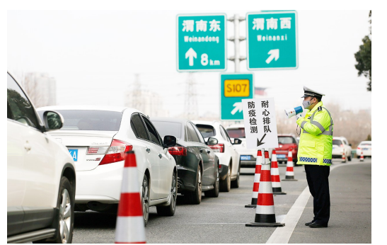
2月2日,连霍高速陕西渭南西收费站匝道分道路段,高速交警用喇叭喊话提醒返程驾乘人员佩戴口罩,保持车辆通风。当日,各地迎来返程高峰,加之进行防疫检测,使渭南西高速口出现短时拥堵,渭南高速交警大队通过调整检查站点位置,增设检查通道,设置紧急通道等方式,提高检查效率。