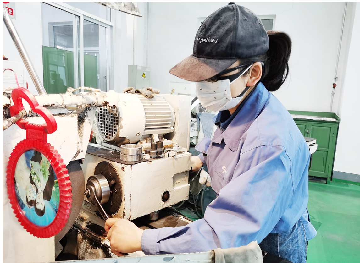
1月26日,西北机器有限公司第六分厂接到陕西新材料公司紧急求援,急需一批用于疫情防护口罩原材料无纺布加工生产的分切刀片,该公司紧急组织相关人员加班突击生产。

旅客,临近春节返程高峰,由于疫情形势不断变化,近期航空公司的航班计划调整较多,个别航班随时会作出调整,请广大旅客在出行之前,通过多种渠道密切关注航班变化动态,及时调整行程安排。如遇航班取消,及时办理“退改签”。机场是人流密集场所,尤其在春运返程高峰,存在交叉感染风险,除非确有必要,建议旅客尽量减少出行、错峰出行;乘坐航班出行时,应全程做好个人防护。目前,机场已对进入航站楼人员进行了限制,除乘机旅客、医疗救护、防疫工作人员外,其他人员无法进入航站楼,请广大旅客给予理解。为了防范疫情通过空中通道传播,各机场都采取了严格的防控措施,对旅客进行测温、个人健康信息登记。