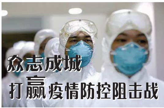
众志成城 打赢疫情防控阻击战

华电陕西公司 1月23日,华电陕西能源有限公司紧急采购口罩等防控物资,由主要领导带队发放至每名员工,为春节值班和返家做好准备。实行24小时值班和“零报告”制度,畅通信息报送渠道,每天统计了解各单位动态。多方协调采购N95口罩、酒精、消毒液等物资,于1月26日发往兄弟单位华电湖北公司。截至1月25日,筹集15310元捐至武汉市慈善总工会,用实际行动抗击疫情。 水电三局集团 第一时间做出反应,从掌握员工动态、减少人群聚集、搞好环境卫生等方面对疫情防控工作高标准严格要求。各分公司及时组建防疫工作微信群,分散各地的广大员工能够实时互联互通,筑牢重重防线。水电三局职工医院全院医护人员取消春节假期,并开设发热门诊、发热诊疗室,做群众健康的“守门人”。与此同时,水电三局境外各分公司和项目及时传达落实公司的部署安排,通报国内疫情动态,有效稳定了境外员工队伍情绪。