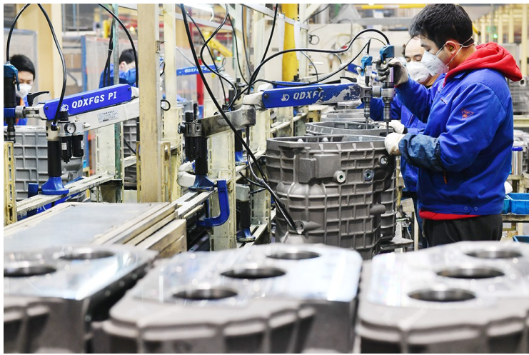
2月10日,工人在法士特变速箱生产线上作业。当日,陕西法士特汽车传动集团在做好疫情防控的前提下,开始有序复工复产。

一批批企业陆续复工复产,一个个项目加快开工建设……连日来,陕西全力抓好疫情防控和改革发展稳定各项工作,陆续推出减轻企业负担、帮扶企业应对困难的措施,在做好疫情防控的前提下,吹响企业复工复产的号角。