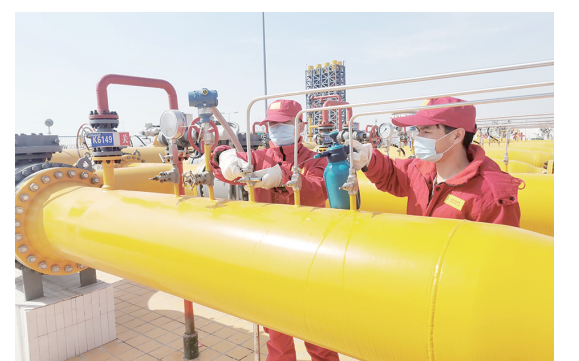
省天然气股份有限公司在做好疫情防控的前提下,全面推进复工复产,切实做到“两手抓、两不误、两推进”,以双倍的责任心和使命感,确保全省天然气输管网安全平稳运行。

根据西安高新区出台的《关于应对疫情进一步强化金融支持企业发展的专项政策》,保险公司对西安高新区企业设计出复工复产综合保险,区内符合条件的企业购买复工复产综合保险的保费支出将会获得50%补贴,每家企业最高补贴20万元。 在陕西银保监局指导下,这张全省首单复工复产企业疫情防控综合保险单在西安高新区开出。该综合保险保障金额200万元,保险期限为6个月,主要保障责任为企业复工复产后因疫情导致紧急停工所造成的在制品实际损失,因封闭或隔离而造成的营业场所、设备租赁费用损失,由政府强制要求隔离的雇员补偿费用(每人每天补偿200元,最高赔偿期限14天)以及确诊病例发生后场所消毒等防疫费用支出。