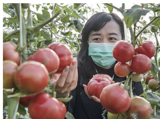
2月26日,一名顾客在渭南市华州区柳枝镇莲峰果蔬产业园的大棚里采摘西红柿。

据省卫健委医政医管局副局长刘娜介绍,截至目前,我省已有22批1460名医护人员驰援湖北战“疫”一线。其中,医生349名、护士816名、技术人员26名。截至3月2日8时,我省累计救治患者1770人,其中重症和危重症患者623人,累计治愈出院患者798人。