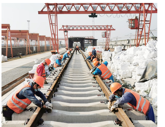
连日来,中铁一局玉磨铁路铺架制梁工程YMPJ标段项目部,一手抓疫情防控,一手抓复工复产,全力以赴奋战施工一线。

据了解,这4个项目涉及新能源发电、综合利用发电、轨道交通供电、园区供电优化四个方面,按计划将于2020年完成并网。4个项目社会效益明显,将对陕西经济社会发展发挥重要促进作用。