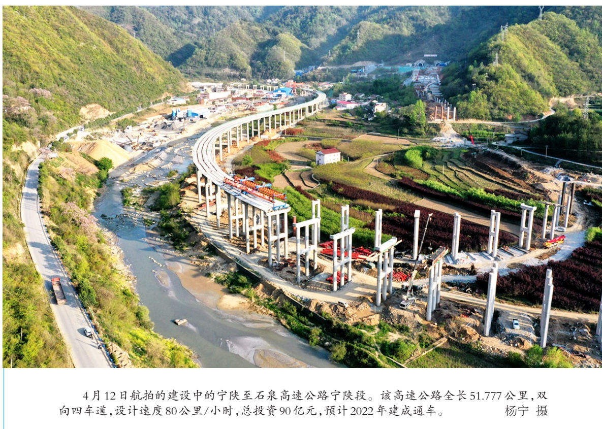
4月12日航拍的正在建设的宁夏至石泉高速公路宁陕段。该高速公路全长51.777公里,双向四车道,设计速度80公里/小时,总投资90亿元,预计2022年建成通车。杨宁 摄

加收入。 目前,我省56个贫困县区已全部摘帽,全省区域性整体贫困得到解决,贫困群众收入水平大幅度提高,贫困地区基本生产生活条件明显改善,贫困治理能力提升。