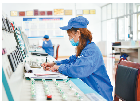
↑自2月24日复工复产以来,北化研究院集团惠安公司在抓好疫情防控的同时,周密部署,合理安排生产,一季度,实现主营业务收入47264万元,工业总产值累计完成80503万元,同比增加15.1%。五家重点民营企业合资公司产销两旺,实现盈利。因为该公司职工正在加紧调度生产。