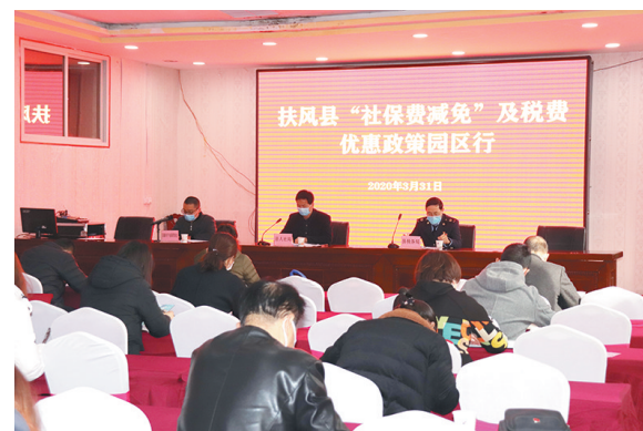
连日来,宝鸡扶风县人社局联合县税务局组成社保费减免及税费优惠政策宣讲团,先后走进扶风县科技工业园和县新兴产业园,将社保费减、免、缓、返“退费红包”及税费优惠政策“培训套餐”送进园区企业,帮助64户企业、21个重点项目负责同志掌握退费操作流程,助力企业复工复产。图为宣讲团在企业宣讲惠企政策。

业内人士认为,当前新冠肺炎疫情严重冲击世界经济,不稳定、不确定因素增多,加工贸易受疫情影响更快速直接,面临需求端和供给端“双向挤压”,需要更多举措为加工贸易企业纾困解难。