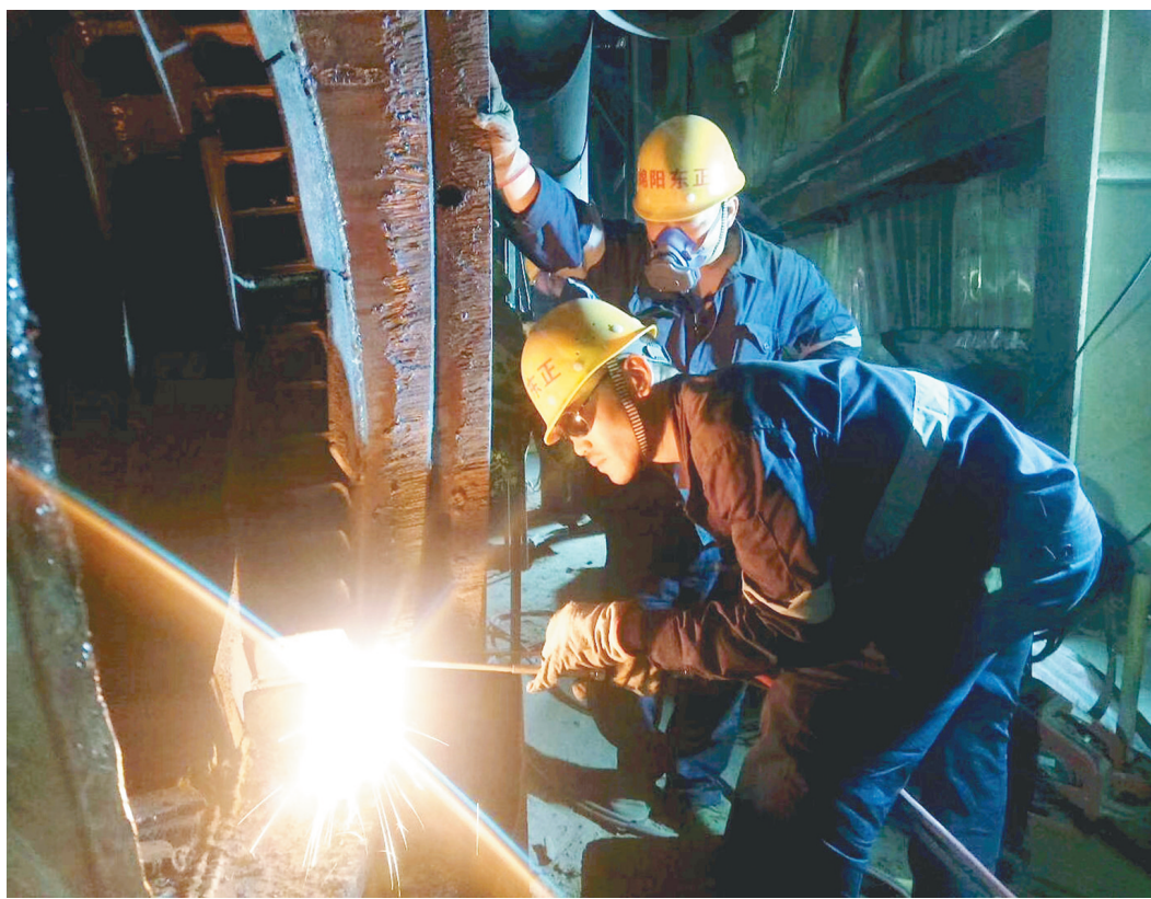
近日,彬州市瑞池发电有限责任公司在一手抓防疫一手抓生产“两不误”情况下,组织员工复工复产,力求减轻企业因疫情增加的负担。图为工人正在生产车间进行焊接作业。

中铁高铁电气公司自3月2日全面复工以来,一手抓疫情防控,一手抓产能提升,为复工复产按下“快进键”。复工一个多月以来,公司产能较往年同比提升18.8%,不仅确保了海外订单顺利交付,同时为国内京哈、焦柳高铁线路和上海、太原、济南的地铁线路等50余条轨道交通项目供应接触网零部件,为全国各轨道交通项目复工建设提供了保障。