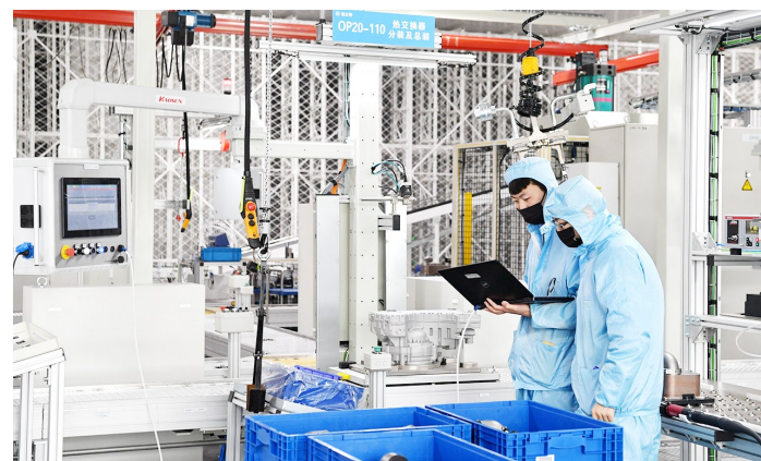
产业工人 在咸阳法士特集团工作车间内调试设备

陕西省工信厅厅长张宗科表示,目前全省工业发展正处于“爬坡过坎”的重要阶段,必须抓住智能制造发展机遇,抢占未来发展制高点。今后陕西将进一步加快传统产业的智能化改造,每年认定省级智能制造试点示范项目1000个,从而有力推动装备制造业的“智造”水平完成嬗变。(毛海峰 雷霄霄 薛天)