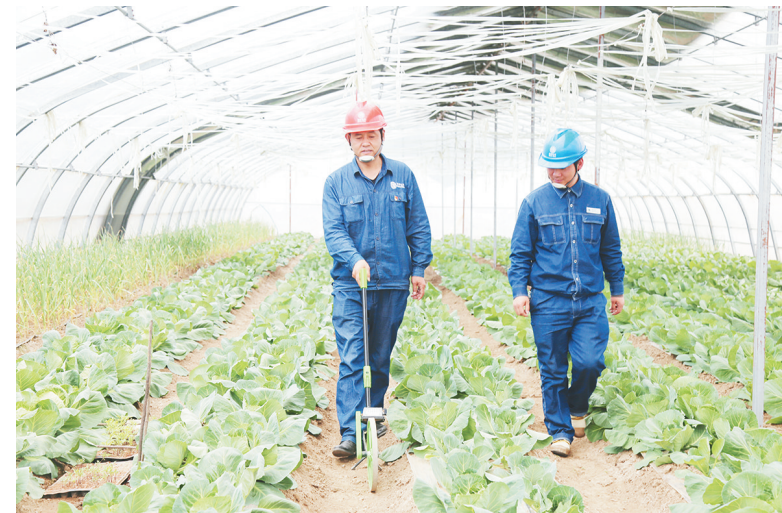
4月19日，国网铜川供电公司瑶曲供电所驻村工作队队员为车洼村大棚菜灌溉设施进行测量设计。该所承担着瑶曲镇车洼村25户的脱贫攻坚任务，他们坚持定期上门走访，及时帮助贫困户解决实际难题。