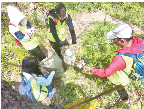
今天是第51个“世界地球日”，4月19日，来自西安益友环保团队的30名志愿者登临秦岭子午峪，开展“保护一座山·温暖一座城”环保志愿服务行动，志愿者们通过自己的实际行动守护秦岭。

事实上，我国实施阶段性减免企业社保费政策，正是统筹推进疫情防控和经济社会发展，稳企业、稳就业的一项重大举措，给全国企业，特别是中小微企业减负今后几个月的养老、失业、工伤保险单位缴费，实现了普惠与精准相结合，可显著减轻企业负担，稳定预期，帮助企业尽快走出困境。国家税务总局社会保险费司副司长王发运进一步介绍，实施阶段性减免企业社保费政策是我国推动企业有序复工复产作出的重大决策，是我国社会保障制度建立以来最大规模的减免优惠。通过“减、免、缓”的政策叠加，我国为疫情影响下遭受“旱灾”的企业送来了“及时雨”。与此同时，阶段性减免企业社保费政策不仅缓解了企业生产经营的燃眉之急，助力市场主体经营持续回暖，还能刺激企业不断扩大生产新动能，在创新创造中自主“造血”焕发新生机。（柏晶）