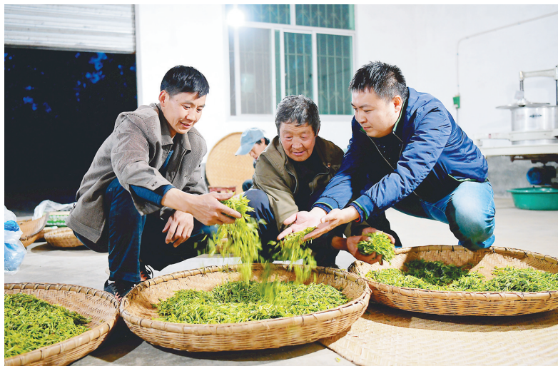
4月19日，正值谷雨时节，汉中市勉县当地毛尖茶叶产量逐渐增加，为确保当地新茶外销渠道畅通，中国铁路西安局集团有限公司西安车站驻丰川镇骆驼巷村干部为茶农拓展销售渠道献计献策，推动产业扶贫和消费扶贫力度。图为驻村干部（右一）走访茶农，了解茶叶收购和外销情况。