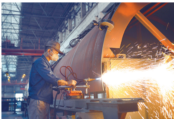
“火神”就位