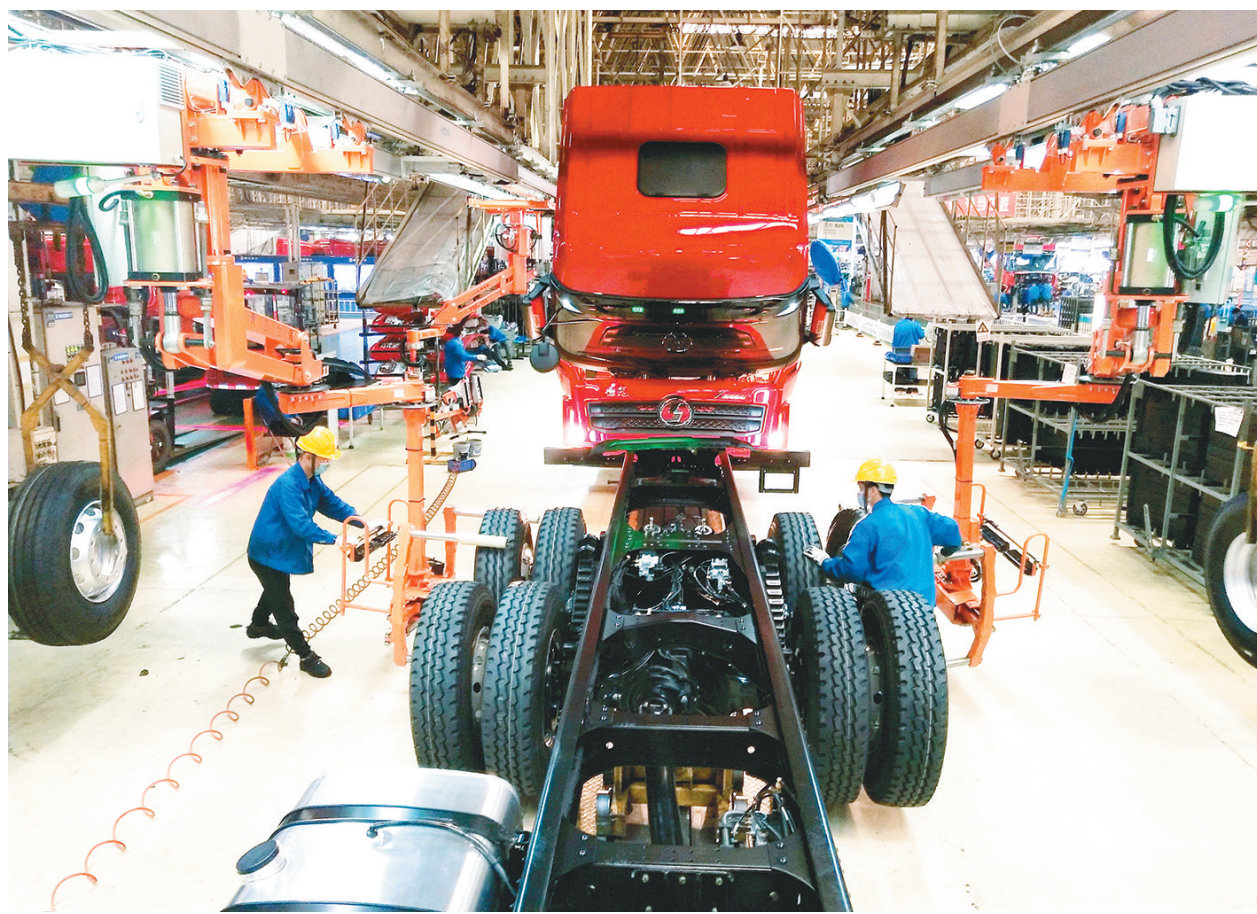
抗击疫情全面复工复产

活动开展以来,共征集来自全市各行各业摄影作品近万幅,广大职工摄影爱好者把镜头对准新时代建设者里最普通的职工和最平凡的场景,用动与静、光与影、沉静与律动、简约与宏大,向我们展示着劳动之美、担当之美、奉献之美。□