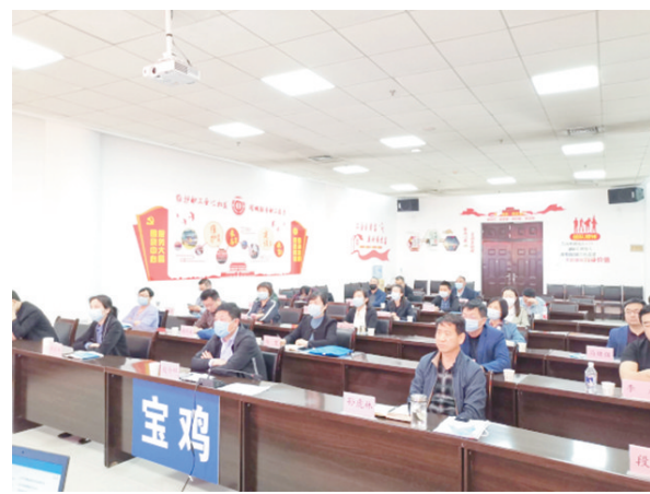
近日,宝鸡市总工会组织渭滨、金台、陈仓区总工会,高新区总工会相关部门负责同志和宝钛集团等20家企业的工会干部,参加全国“和谐同行”网络视频培训会,开启了该市2020年“和谐同行”培育行动。