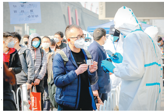
我要复工了