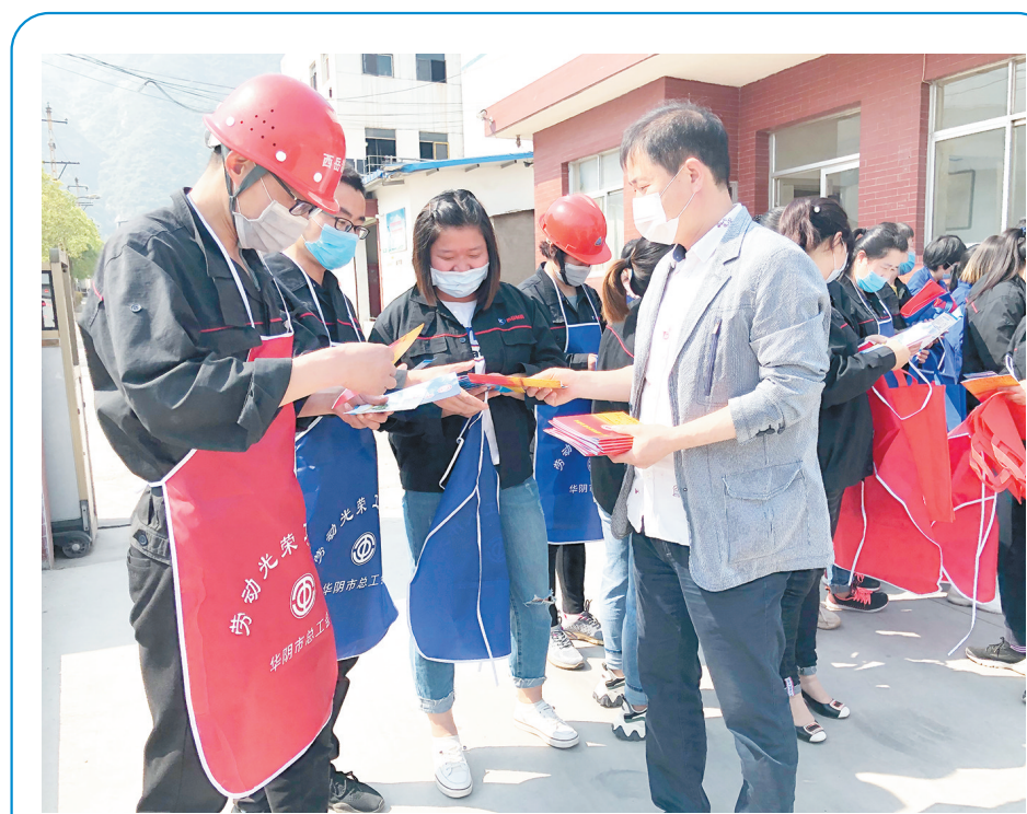
连日来,华阴市总工会深入基层,走近职工,开展“往职工中走、往心里做、往实处落”大走访大调研活动。

在很长一段时间,优秀工人、劳动模范是选拔领导干部的来源之一,其中有不少工人成长在农村,而后进城工作,在新中国历史上,也不乏从基层工人成长为国家领导人的成功案例。但不可否认的是,这样的渠道越来越窄了。在许多单位,包括班组长在内的基层工人和管理岗位之间隔了一道无形的墙。事实上,随着产业结构调整和工人素质提升,包括农民工在内的,不少年轻工人已经具有本科以