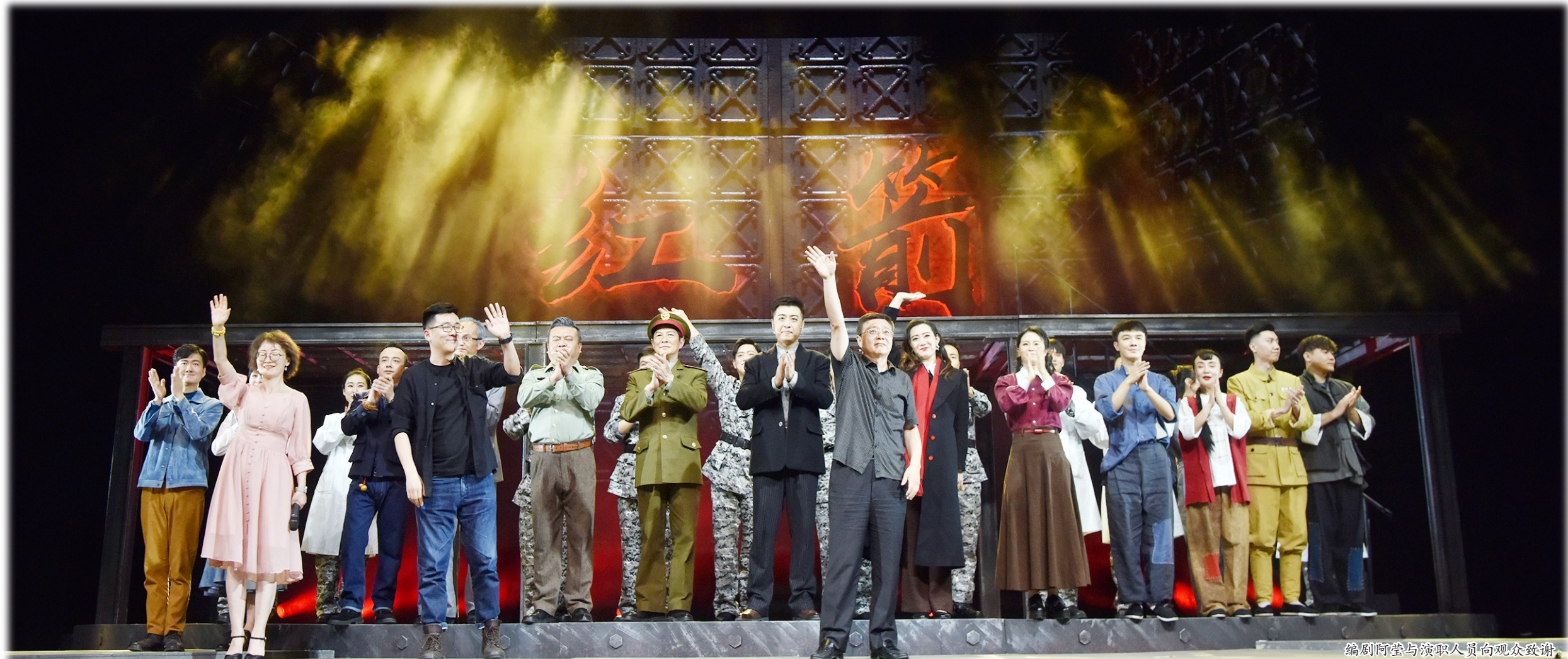
编剧阿莹与演职人员向观众致谢