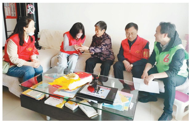
今年以来,咸阳彬州市选派全市266名党员干部深入社区担任小区楼栋长,通过上门走访、电话约谈、微信交流等形式,打通精准服务群众的“最后一公里”。图为党员干部开展走访慰问活动。