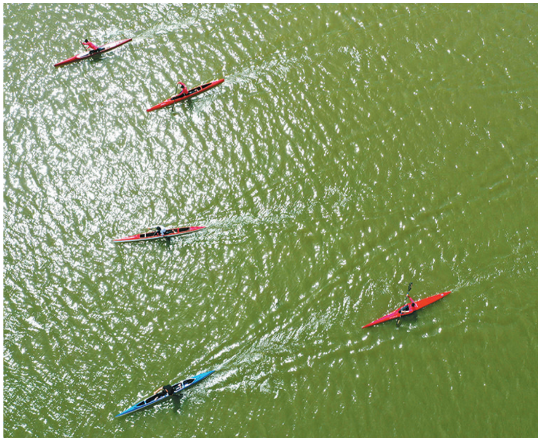
6月7日,渭南市涇河公园北段,学生进行皮划艇训练。随着进入疫情防控常态化阶段,近一段时间渭南市青少年体育运动学校

90后开始成为小店经济发展的新兴力量。在5月新增商户中,20-29岁商户占比达到24.6%。同时,低门槛的数字化工具也让各个年龄段商家共同复苏,50岁以上新增小商家占比也达到18%。