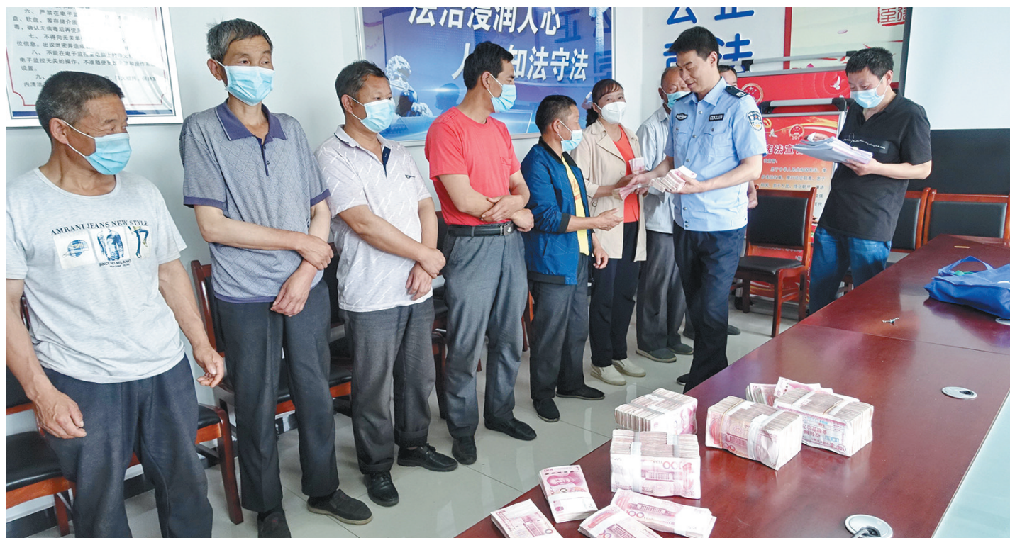
近日,经过西安市周至县司法局两周的轮训,十多名农民工代表现场领到70多名陕、甘、川籍工友被拖欠的工资71.5万元。