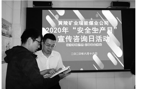
6月16日,黄陵矿业瑞能煤业公司开展安全咨询日活动。当天,该公司组织全矿6名安全生产技术人员对当前开展的“学法规、抓落实、强管理”等关于安全生产法律法规及安全整治活动等要求进行了现场解答。图为该矿技术人员现场交流NOSA风险管理知识。