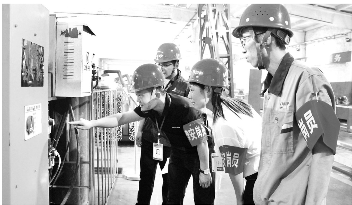
日前,韩城矿业公司按照“安全生产月”活动要求,以矿区安全文化活动为纽带,以活动促落实,以落实促发展。所属各单位结合自身实际,制定落实方案,策划系列活动,并采取小课堂、大