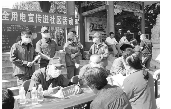
“怎样才能节约用电?”“电磁炉、电视、空调这些电器不用时要切断电源,待机很费电……”6月18日,蒲白矿业热电厂开展“安全用电宣传进社区”活动,该活动不仅提高了矿区职工群众的安全用电意识,增强自我防范能力,也预防了电力伤害事故的发生,受到了职工群众的欢迎和好评。图为志愿者向职工群众宣传和讲解夏季安全用电、节约用电常识。