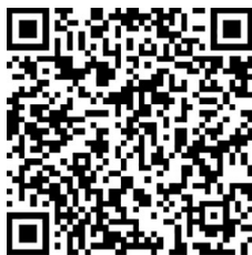
小镜头折射大安全 (澄合矿业百良公司)