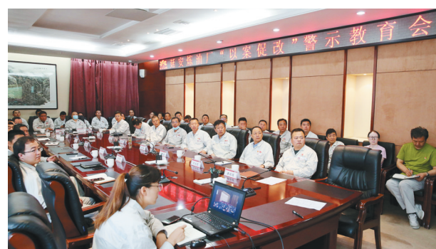
近日,延长石油集团延安炼油厂纪委组织相关人员观看了《叩问初心》专题警示教育片。该片分“信仰之失、贪欲之害、围猎之祸”三个部分。片中触目惊心的违纪行为、违纪违法者声泪俱下的忏悔,深刻揭示腐败的危害性,警示党员干部时刻保持坚守底线、不碰红线,增强廉洁自律意识,提高拒腐防变能力。

广告而发生争执,韩某在劝解过程中倒地死亡。经查,“夫妻档”是此次上诉人公司保洁员较常见的工作模式,且上诉人公司未提交证据证明其对此模式是绝对禁止的,因此,不能片面依据考勤表上韩某的工作时间为上午的记载,就作出韩某发生死亡事故不在工作时间的认定。此外,韩某去距离其负责路段最近的兴庆路东侧上厕所,系其与妻子交接的过程中为解决生理需求而为,且韩某死亡事故是在阻止张贴小广告过程中,因此,涉案的碑林区人社局与市人社局认定韩某死亡地点并非工作场所亦属不当。