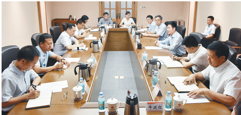
会议现场。

本报讯(记者 阎瑞光)8月5日,省总工会与西安市莲湖区委、区政府就老旧小区改造工作进行座谈。省人大常委会副主任、省总工会主席郭大为出席并讲话。省总工会常务副主席张仲茜,省总工会党组成员安强,省总工会副主席、一级巡视员丁立虎,西安市莲湖区委书记张涌,区委副书记、区长王永杰出席。省总工会、莲湖区相关部门负责人参加座谈。