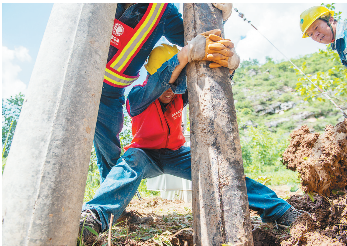
面对洪灾,国网商洛供电公司上下齐心协力,做到“水退、人进、电通”。截至8月9日6时,累计恢复9条10千伏线路。图为该公司共产党员突击队冲锋在抢修一线。

眼圈发黑,声音嘶哑,踩着胶鞋,卷到小腿肚的裤脚上满是泥点……这是抗洪一线基层干部的“标配”形象。面对肆虐的洪水,他们筑起防线,成为挡在群众身前的一道坚实堤坝。 庚子之夏,南方多省发生严重洪涝灾害,累计降水量之大、梅雨期之长、覆盖范围之广,历史罕见。水位上升速度论分钟计,管涌与渗漏漏处可能发生,行蓄洪区的启用命令随时可能下达……在众多不确定性当中,基层干部成了让老百姓安心的存在。 风浪拍不翻,激流冲不走,他们用信念武装自己。“群众利益高于一切”的承诺深深根植于每个奋战在抗洪一线的基层干部心底。在溃口的堤坝,在被洪水围困的圩区,在即将蓄洪的闸下村庄,最危险的地方总有他们坚守的脚印;只要群众还没有安全转移,他们就不会撤。 把胸膛交给洪水,把后背留给百姓,他们把责任揉进生命。这一刻的坚守只是他们长期以来扎根群众、心系群众的一个缩影。始终把让群众生活得更好这份责任扛在肩上,始终坚持群众利益无小事,久而久之,一遇到危难首先想到群众是否安康,一碰到好事首先想到把利益让给群众,成为他们义无反顾的选择。 不敢合眼休息、怕生病受伤耽误工作、怕有一个群众不安全……正是因为有坚定的理想信念与坚实的责任担当,在汛情最严峻的时候,他们冲锋在前,和人民群众安危与共,风雨同舟,为的就是给群众换来一个又一个安稳夜。 当前,防汛这根弦仍不容松懈,久在一线的基层干部仍需继续发扬不怕疲劳、连续作战的精神,为百姓安危站好每一班岗,坚定群众恢复生产生活的信心,帮助群众重建家园,尽快恢复正常。(汪丽娜)