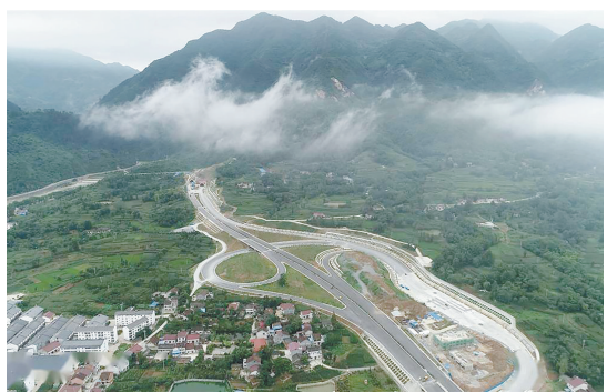
日前,汉中市西镇高速西乡县至镇巴县高速公路的路基主体全线建成。路线全长49.5公里,设计时速80公里,为双向四车道,全线桥梁和隧道所占比例为91.8%,是陕西省近年来所建桥隧比例最高的高速公路之一。

按常规施工方法进行,不仅难度大还增加施工成本。张珂团队分析现场情况,优化施工措施,认真考量分析,革新施工方法。以往插拔式电缆头安装需要12人,优化措施后只需6人。以往安装好一组耐压试验闷头用时约60分钟,优化后只需30分钟。通过他们改良措施,既减少了人力,又提高工作效率,为公司节约成本8.04万元。 班组长李进说,“和张师聊天都能学到知识,激发我们学习兴趣!”徒弟马龙说:“我敬重师傅,不仅是他的技术,还有他良好的职业道德!”张珂却说,我们班组有活力,主要是这群年轻人有上进心,愿意学,我带起来也轻松。(李彩霞)