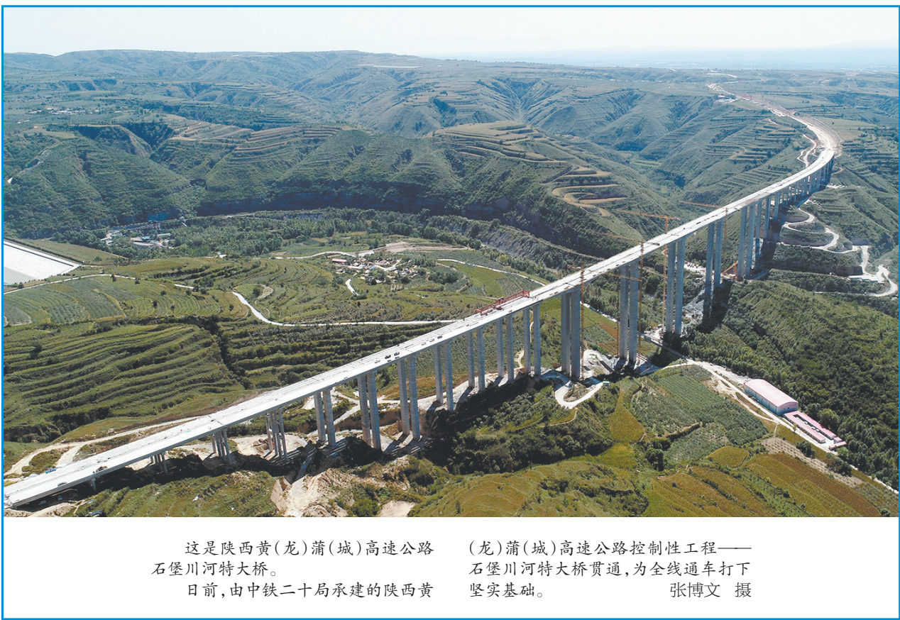
这是陕西黄(龙)蒲(城)高速公路(龙)蒲(城)高速公路控制性工程——石堡川河特大桥。日前,由中铁二十局承建的陕西黄(龙)蒲(城)高速公路控制性工程——石堡川河特大桥贯通,为全线通车打下坚实基础。

9月26日,游客从西安火车站出发,环游秦岭,抵达商洛品赏陕南美食。当日,“陕西人游陕西”和“惠游陕西”活动再度开启,陕西国旅旅服传媒集团联合商洛市政府,开行周末两天两趟“秦岭号·商旅旅游”专列。