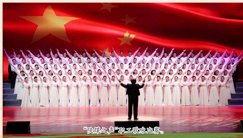
“陕煤之声”职工歌咏比赛。