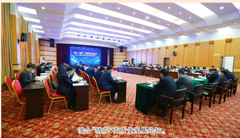
澄合“绣花”高质量发展论坛。