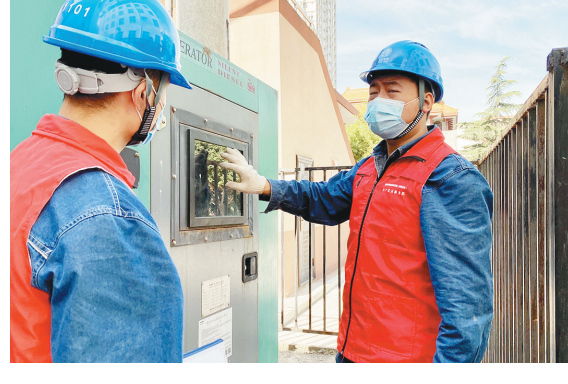
连日来,国网西安供电公司长安公司“秦岭长安”共产党员服务队走进辖区中小学校,对校园内箱式变压器、配电室等电力设施进行全面体检,为中小学生学习用电保驾护航。