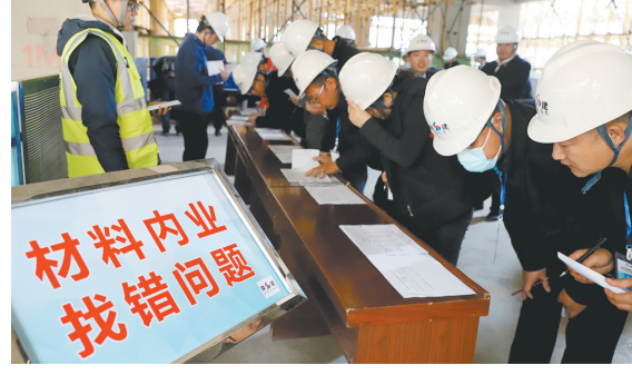
10月12日,陕建集团2020年度“十佳”材料员竞赛决赛实操考试在陕建一建七公司曲江·德园中学项目部举行。图为比赛现场。