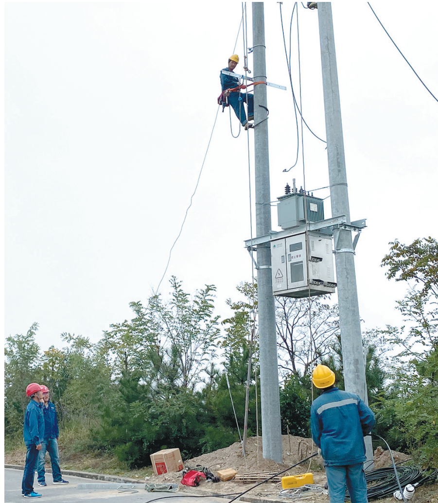
10月12日，国网西安供电临潼分公司利用PMS系统监测到土桥街办房岩村配变异常，电压偏低。该公司第一时间架设一台100千伏安变压器，解决了低电压问题，保障了电网安全运行。

如今，神延铁路已经从当初的区域铁路，成为连接南北、贯通东西的客货铁路大动脉，每日开行的客货列车近百对，年货运通过量达到7000万吨以上，有效保证了当地煤炭、石油、农产品的快速流通，为区域经济发展作出了贡献。同时，西延维管处也缔造了保障铁路安全生产近7000天的奇迹。 □赵海霞