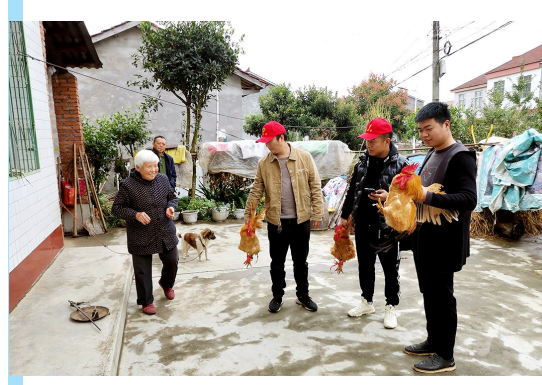
10月14日,汉中公路局城固公路段的党员志愿者们到扶贫帮扶点杨河村,帮贫困户打扫卫生,临走还购买了贫困户养殖的鸡鸭等农副产品。