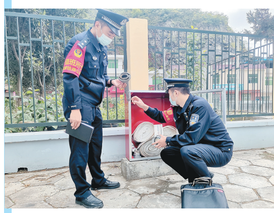
连日来,安康铁路公安处旬阳北站派出所积极做好治安管控、消防检查、线路巡防等工作,确保辖区治安秩序持续稳定,旅客平安出行。图为民警进行消防检查。