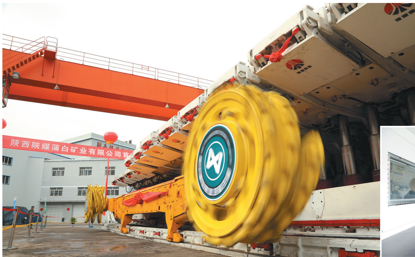
←智能化综放设备启动后采煤机滚筒快速旋转。